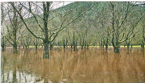
Genug Wasser für die Bäume zwischen Haslach und Steinach – von Frank Neugebauer aus Steinach.