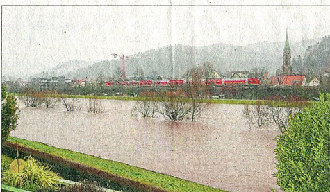
Erwin Fehrenbacher fotografierte von seinem Balkon in Hausach auf die Kinzig.