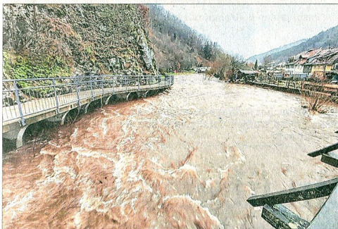
Die reißende Wolf in Wolfach – von Franz Schmalz aus Wolfach.