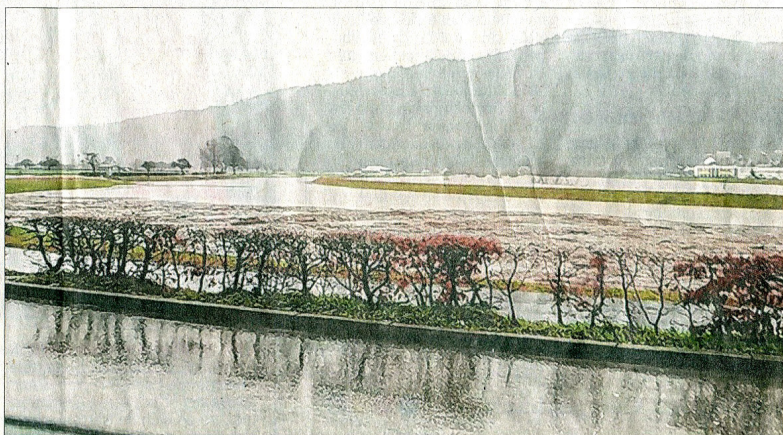
Nancy Stiefvater sandte uns dieses Hochwasserbild aus Fischerbach.