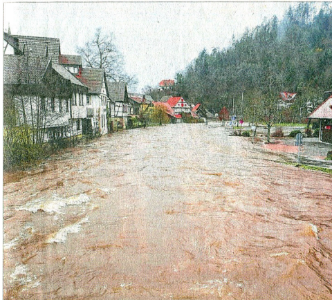
Die Kinzig bedroht die Häuser und Straßen in Schiltach – dokumentiert von Karl-Heinz Wöhrle.