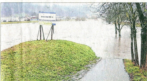
„Keine B33 im Hochwasserschutzgebiet?“ – von Werner Rothmann aus Haslach. Am Mittwoch will das Regierungspräsidium die Pläne vorlegen, wo die künftige Umgehungsstraße genau durchführen soll – und wie man sie gegen Hochwasser schützen will.