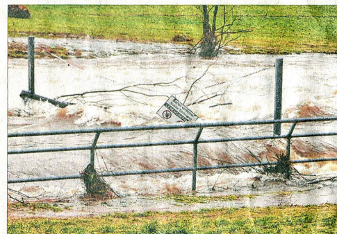
„Baden verboten“ am Hammerwehr in Hausach. Das wird in dieser Situation jedem einleuchten – von Wolfgang Ott aus Gutach.